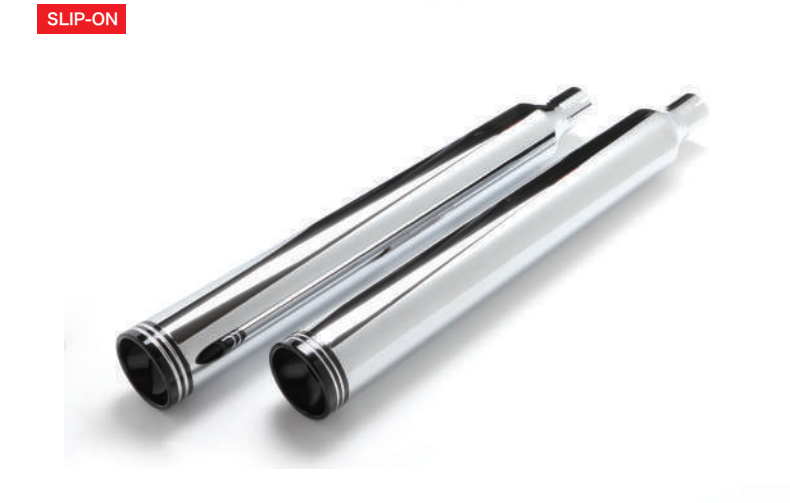
D 外径 90mm/ 全長 720mm ブラス アルティメットラウンド / クローム / 黒エンド