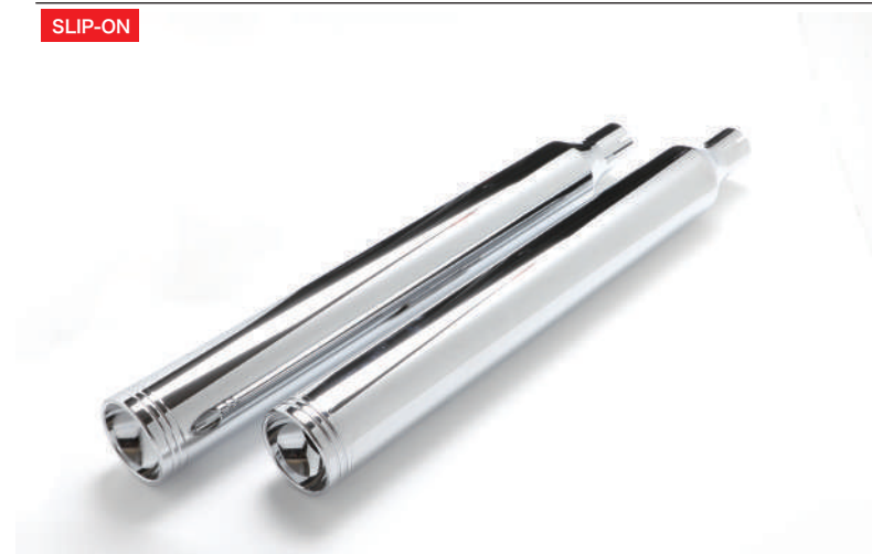
C 外径 90mm/ 全長 720mm ブラス アルティメットラウンド / クローム / クロームエンド