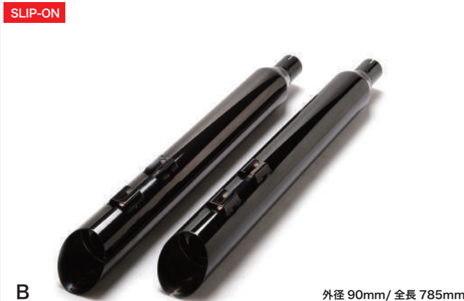
B 外径 90mm/ 全長 785mm ブラス アルティメットスラッシュ / 黒