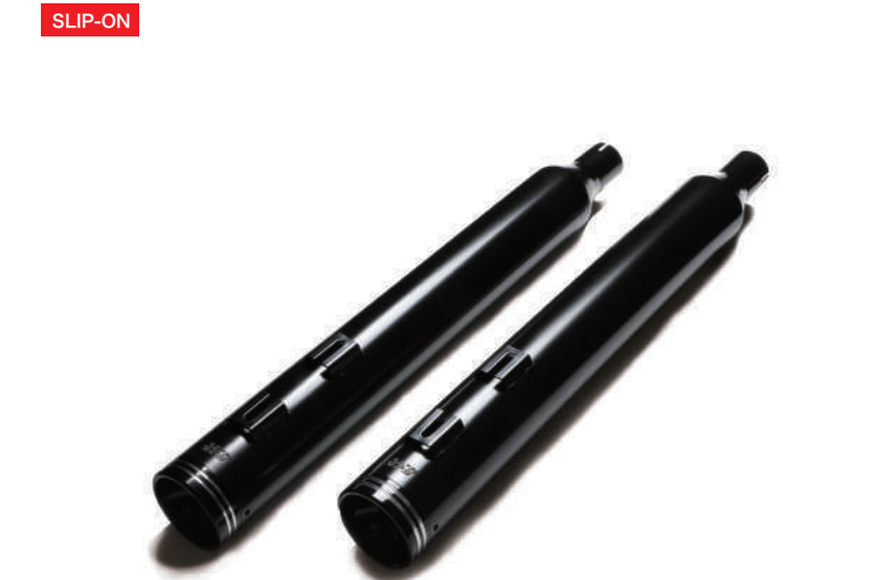
E 外径 90mm/ 全長 720mm ブラス アルティメットラウンド / 黒 / 黒エンド

ブラスアルティメットシリーズ 純正エキパイにスリップオン取付 ~ '08 標準組込済排気穴径 = 6mm (4~12mm 変更可能) '09 - 標準組込済排気穴径 = 12mm