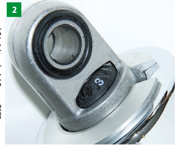
2 リバウンド・ダンパー (伸び側減衰力)調整機構

KONI 譲りの3段階プログレッシブプレート・不等ピッチスプリングに、乗車重量(体重や荷物の重量)や走行状況によって異なる走行荷重に応じて、プリロード(初期荷重=ユニットに圧縮してセットされた状態の荷重)を3段階で変更・調整できます。カンタンな例を挙げれば、ツーリングで重い荷物を載せたり、タンデム走行をするときは、いつもよりサスペンションが沈み込み車体後部が下がった姿勢になります。それをプリロード調整でスプリングを圧縮させ予めセット荷重をかけておくことで、普段の姿勢を回復・保持することができます。プリロード調整には付属のフックレンチを使用します。