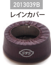
2013039B レインカバー ¥5,800 (税別)