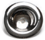
2020171 ミニカバー/クロームメッキ ¥4,000 (税別)