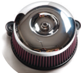
55ラウンドクロームメッキ