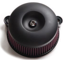
55ラウンド黒マット