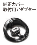
純正カバー 取付用アダプター ¥7,800 (税別)