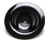
2020172 ミニカバー/黒 ¥5,000 (税別)