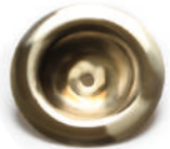
2020170 ミニカバー/真鍮ヘアライン ¥3,000 (税別)