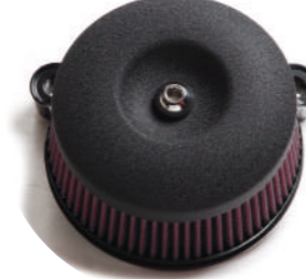
55ラウンド黒リンクル